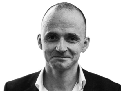
Олександр Лінчевський, заступник Міністра охорони здоров'я України

Шановні медики, ми раді повідомити вам, що Міністерство охорони здоров'я скасувало першу порцію паперових облікових форм, які давно втратили свою актуальність і залишались як рудимент старої (ще радянської) системи паперового документообігу в охороні здоров'я.