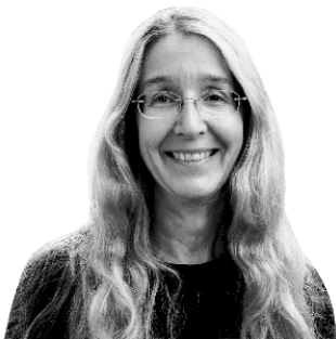
Доктор Уляна Супрун, в.о. Міністра охорони здоров'я