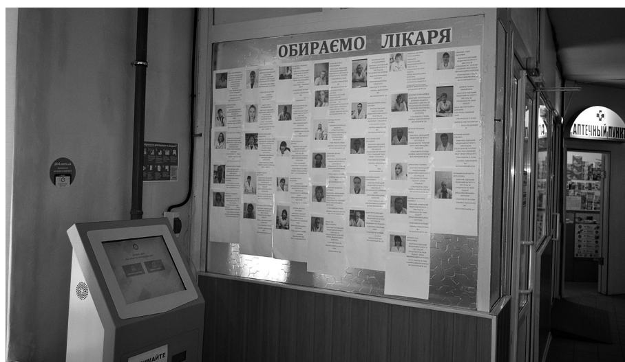
Інформаційний стенд у Центрі первинної медико-санітарної допомоги № 2 м. Миколаєва

Вінницький міський комунальний заклад «Центр первинної медико-санітарної допомоги № 1» включає три амбулаторії та одну філію. У холі кожної амбулаторії розміщено інформаційні стенди про підписання декларацій з лікарем: тут є вся інформація з алгоритмом дій, яка надходила з Міністерства охорони здоров'я. На цих стендах також розміщено інформацію про кожного сімейного лікаря і його фото. Аналогічна інформація є на сайті Вінницької міської